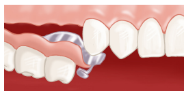
Insertion de la prothèse à châssis métallique