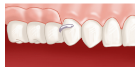
Prothèse en place