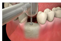
Mise en place de l'implant