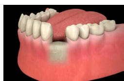
Accès au site

Une anesthésie locale est réalisée. La gencive est incisée et dégagée pour avoir accès au site osseux où la pose de l'implant est prévue. Le passage successif de forets de différents diamètres permet de préparer le logement dans lequel l'implant est ensuite mis en place.